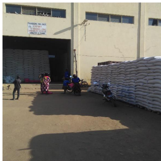
Duas realidades reportando a comercialização agrícola no Niassa: à esquerda, pode-se ver o comércio fronteiriço em Luelele, distrito de Mandimba; à direita, instalações do ICM em Cuamba, ocupado pela Export Marketing.

Como actividades imediatas, descrevem-se as seguintes: