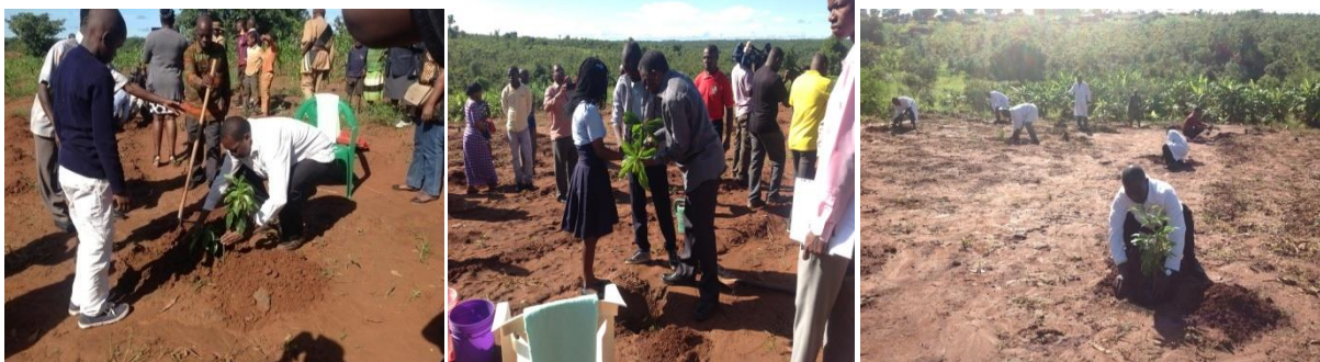
Plantio de árvores

No âmbito do cumprimento da orientação Presidencial “ Um aluno, uma planta por ano ” foram plantadas 16.082 árvores, sendo 3.762 de fruta e 12.320 de sombra.